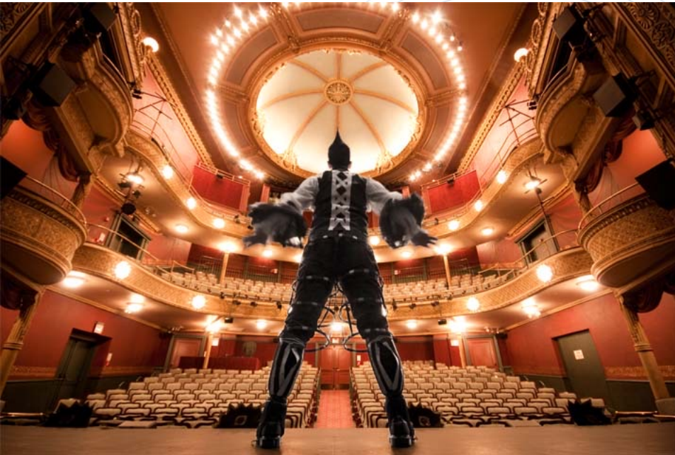
“The Precipice” by Ryan Parker

Wacom launched a contest to celebrate creativity with ICAF.