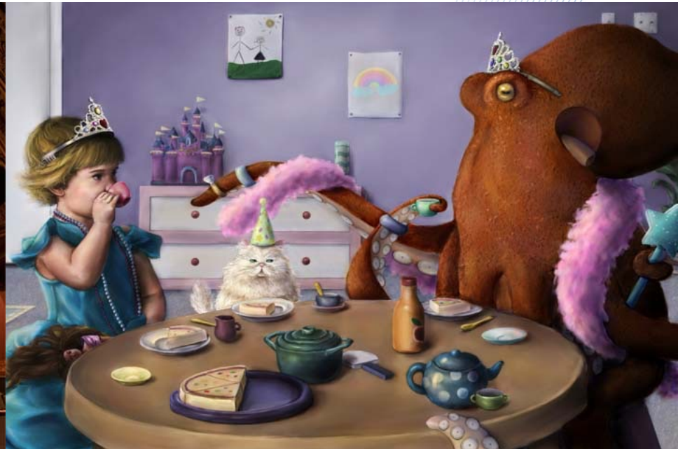
“The Tea Party” by Jessie Edwards